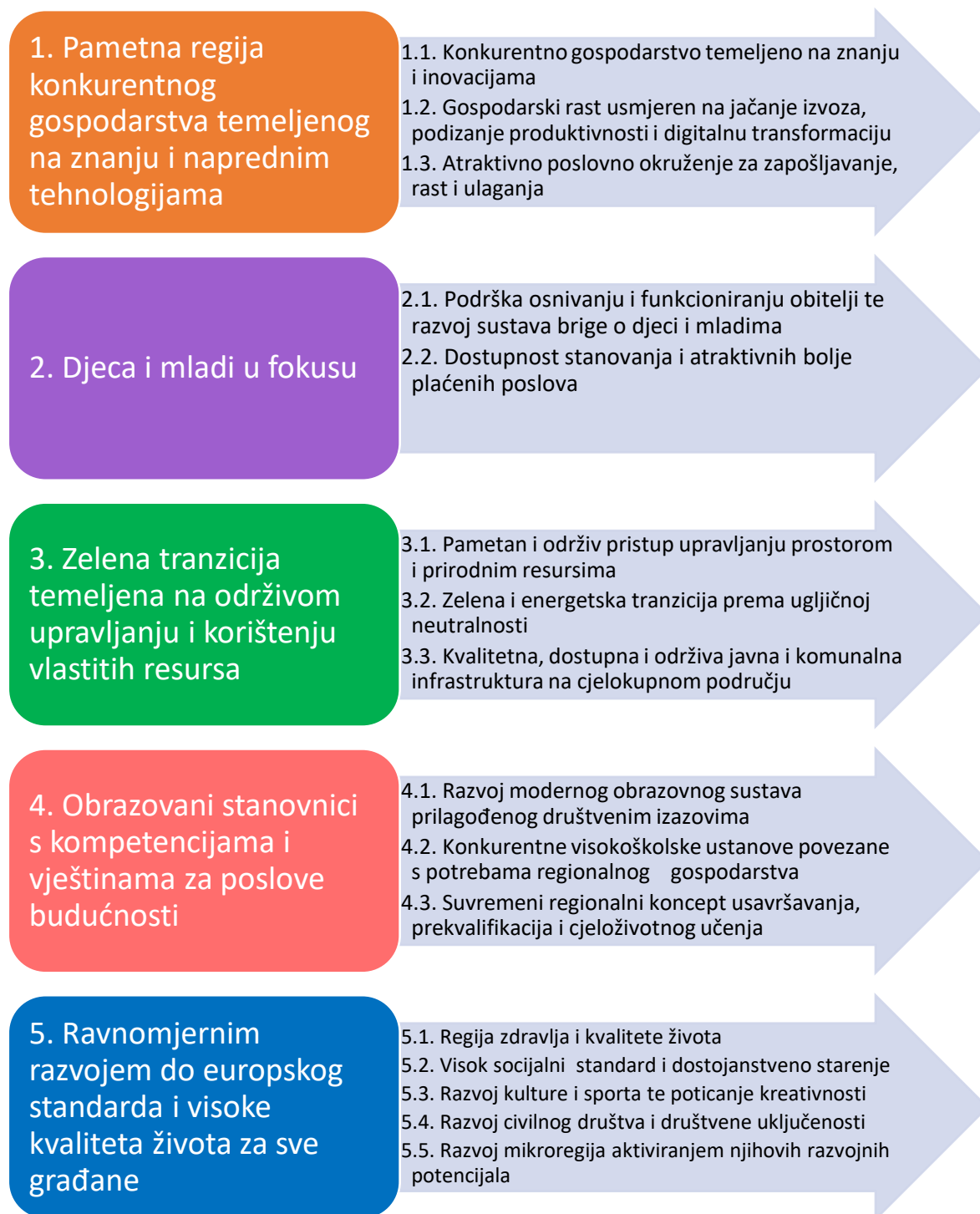
Slika 3.: Strateški okvir Plana razvoja primorsko-goranske županije – prioriteti razvojne politike i posebni ciljevi